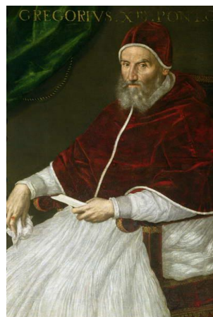
Paus Gregorius XIII